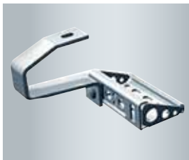
Montage simple et sûr des capteurs grâce aux crochets à chevrons

Le Vitosol 300-T de Viessmann est un capteur à tubes sous vide à haut rendement qui répond aux exigences les plus strictes en termes d'efficacité et de sécurité.