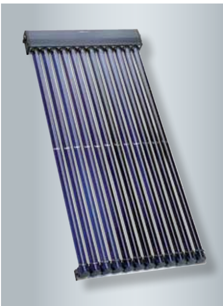
Capteur à tubes sous vide et à haut rendement Vitosol 300-T, type SP3B